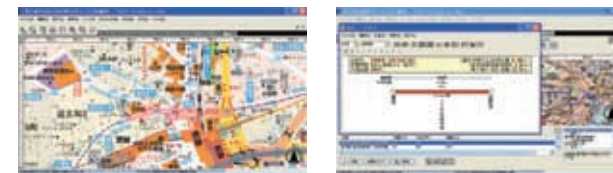
ナビゲーション画面

*1 Bluetooth GPSユニット(別売)やCF型PHS通信カードの接続、またはホットスポットのいずれかで取得可能です *2 「プロアトラス2006 for VAIO」を搭載。地域ごとの詳細記事を別途ダウンロード購入できます。地図のダウンロード販売につきましては、VAIO type Uホームページで詳細をご確認ください