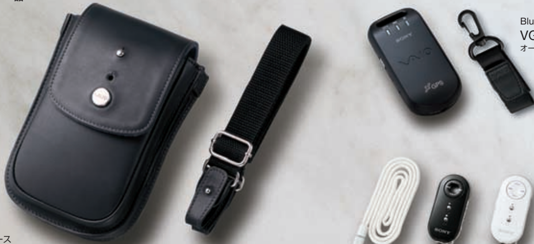
Bluetooth GPSユニット VGP-BGU1 オープン価格