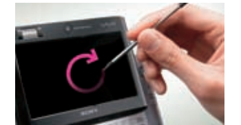
スタイラス(付属ペン)を使って、画面上への文字入力やペンタッチ操作ができます。使わないときは、本体背面にすっきりと収納

「↑」「↓」「←」「→」や「時計回り」、「V字」などの、スタイラスの動きでPC操作が可能な「VAIOタッチコマンド」機能を装備。ブラウザーの「戻る」「更新」や、音楽管理ソフト「SonicStage」の曲送り・戻しなど、さまざまなPC操作を計10種類のジェスチャーで行えます。