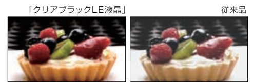
高精細な「クリアブラックLE液晶」を搭載。黒が引き締まり、奥行き感を再現します。 ※比較写真はイメージです

type Uやデジタルカメラで撮影した写真を持ち歩いて、好きなきときにみんなで鑑賞。高精細の4.5型「クリアブラックLE液晶」 ワイド画面に、まるでフォトスタンドで見るように、色合い鮮やかに表示されます。