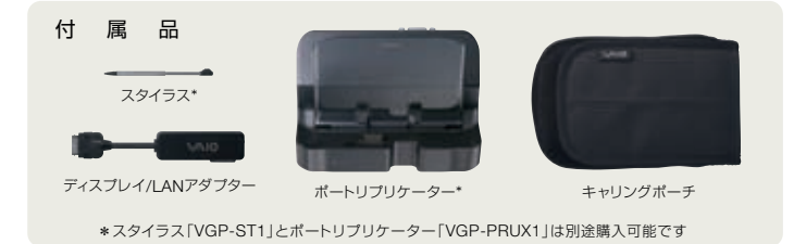
*スタイラス「VGP-ST1」とポトリプリケーター「VGP-PRUX1」は別途購入可能です