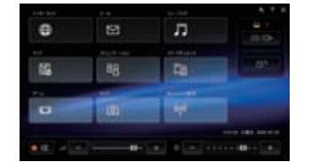
9つの画面表示ボタンに、好みのアプリケーションを割り当てられます

ランチャーボタンを押すと、専用インターフェース「VAIOタッチランチャー」が起動。画面に表示されるアプリケーションボタンのひと押しで、使いたいものをすぐに呼びだせます。