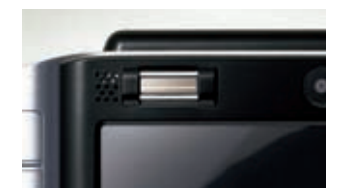
指紋認証により、素早くWindows®にログオンできます

指紋センサーを指でなぞるだけのシンプルな操作で、個人認証ができます。「パワーオン・パスワード」と「ハードディスク・パスワード」、「Windows®のログオン・パスワード」を一度に解除。パスワードを入力するわずらわしさがありません。