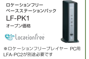
ロケーションフリーベースステーションパック LF-PK1 オープン価格 LocationFree ※ロケーションフリープレイヤー PC用 LFA-PC2が別途必要です

「ロケーションフリーベースステーション」(別売)を自宅に設置すれば、アナログテレビ放送やDVDレコーダーに録画した番組を外出先から視聴できます。