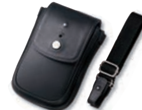
キャリングケース VGP-CKUX1 オープン価格

液晶画面をしっかり保護する、硬い素材入り。側面部には通気性に優れたメッシュ素材を採用。本体電源を入れたままの使用を考慮して、放熱性を高めました。また、付属のショルダーベルトにより、さまざまな取り付け方に対応します。