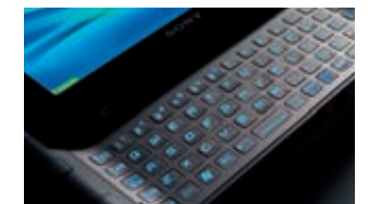
暗い場所でも入力しやすいよう、キーを押すとキーボードバックライトが自動点灯。しばらく操作をしないと自動消灯して、消費電力をセーブできます

両手を使って、いつものタイピング感覚で、テキストを快適に入力できます。キーボードのOPEN&CLOSEは、液晶部分をスライドさせるだけのスムーズさ。また、キーボードのOPENと同時にスタンバイや休止状態から自動で復帰できます。